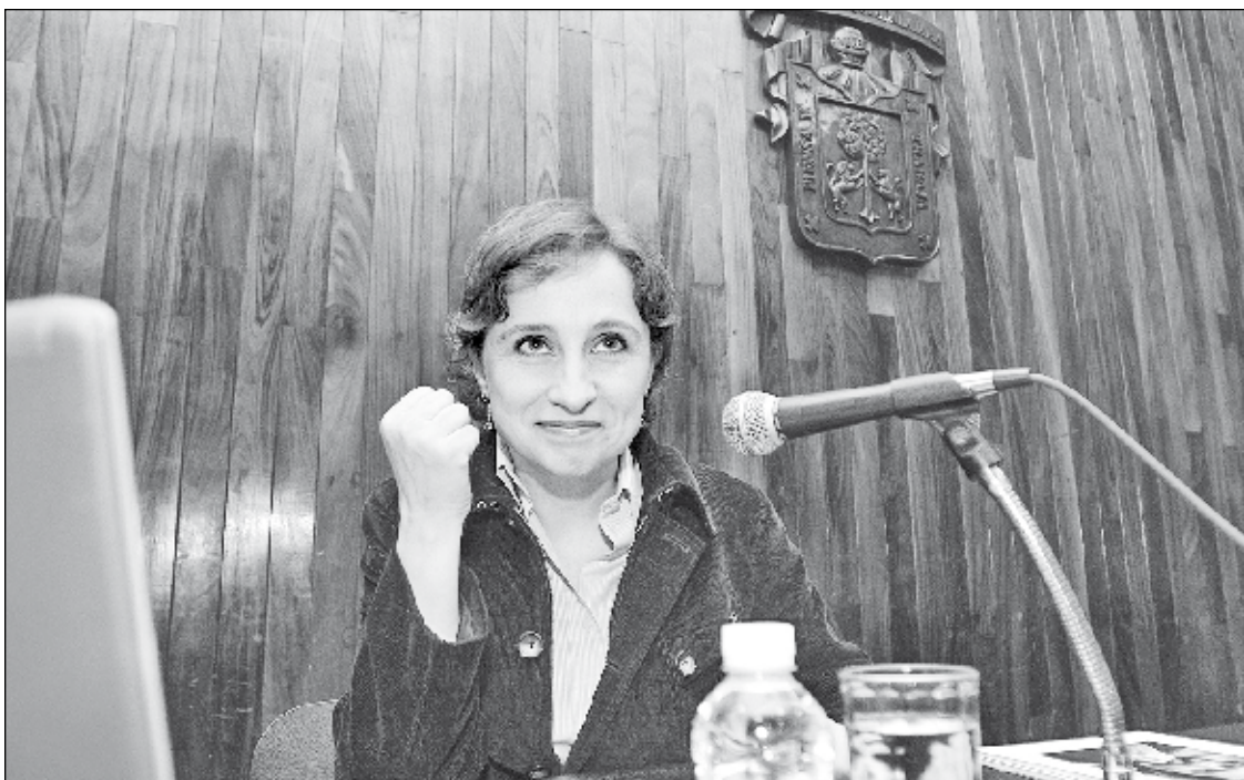
La periodista Carmen Aristegui, durante la conferencia sobre medios y democracia en la Cátedra Julio Cortázar, donde señaló que la devolución de la macrolimosna es un ejemplo de reacción ciudadana ante las decisiones de la autoridad

JUAN CARLOS G. PARTIDA Y VIRIDIANA SAAVEDRA PONCE ■ 5